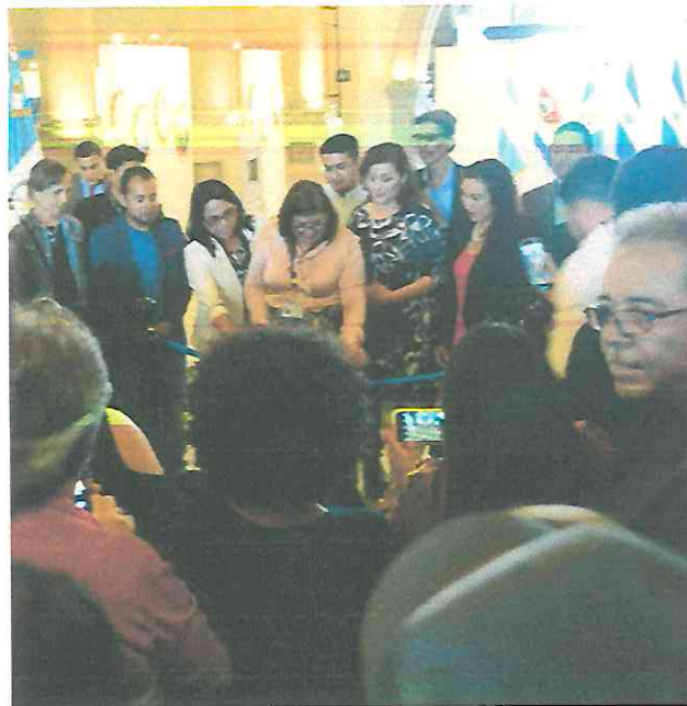
Momento de inauguración.

La exposición fue una excelente actividad ya que se abre oportunidad que personas puedan apreciar el trabajo de varios artistas. La afluencia de personas estuvo con un aproximado de más o menos 60 personas.