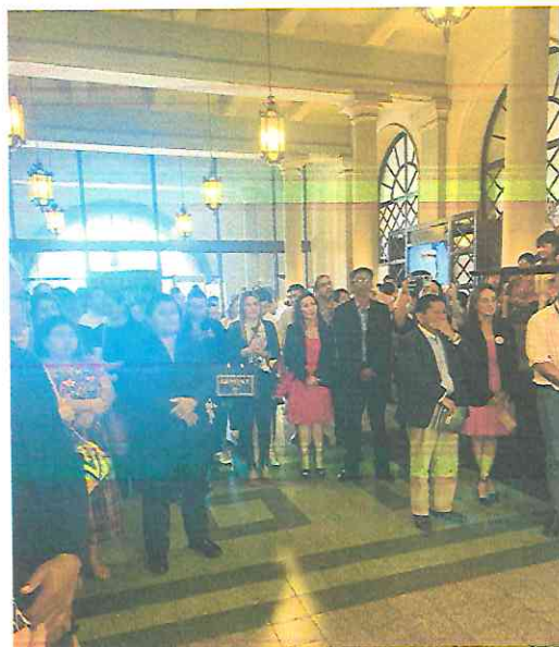
Afluencia visitantes Pasaje Sexta