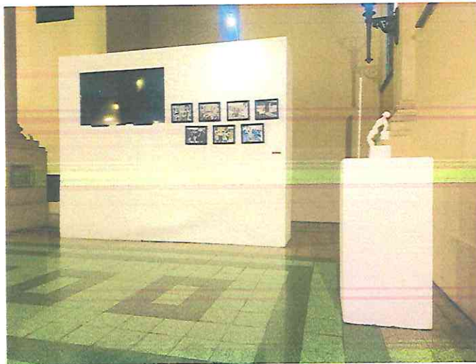
Vista interior Paseo Sexta